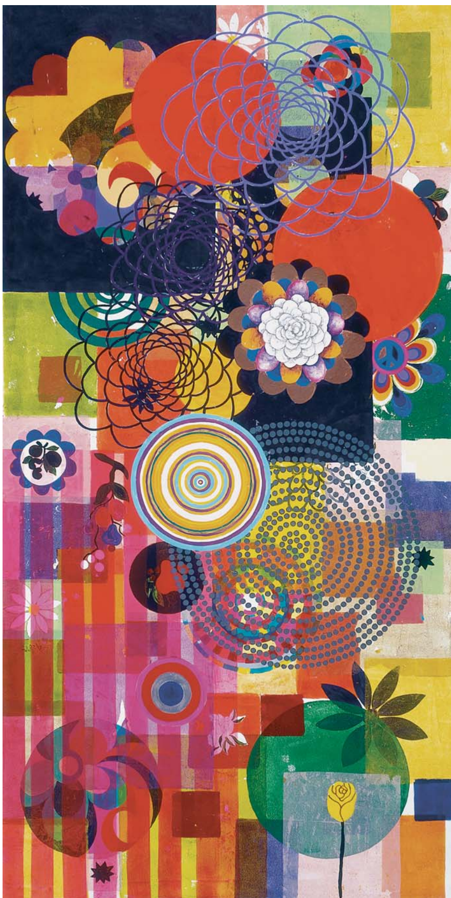
Pipoca moderna, 2006 Acrílico sobre tela, 220 x 110 cm